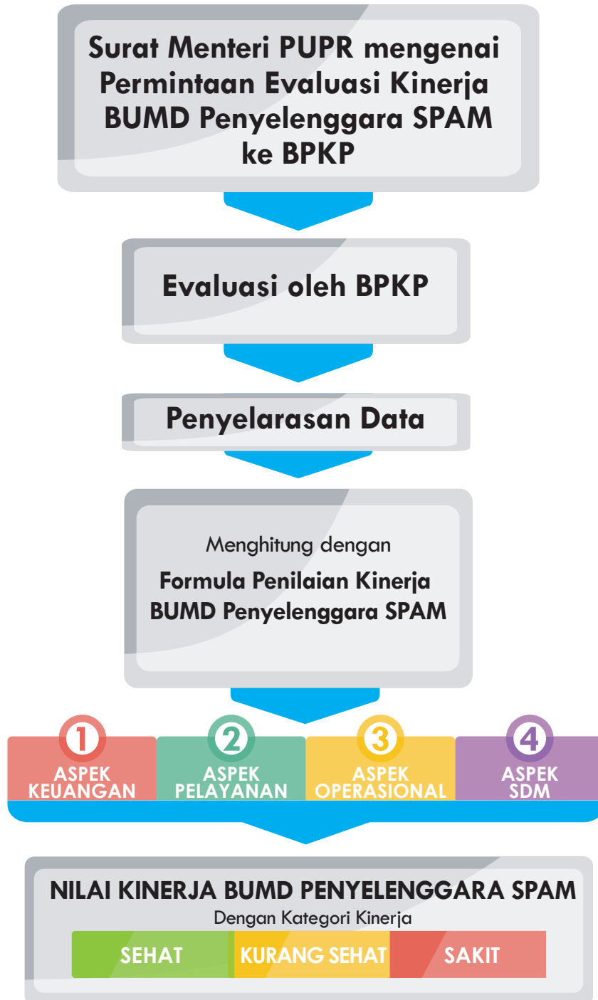
Gambar 1. Alur Proses Penilaian Kinerja BUMD Penyelenggara SPAM

Berdasarkan tugas dan fungsinya, BPPSPAM melakukan penilaian kinerja terhadap BUMD Penyelenggara SPAM. Proses penilaian kinerja BUMD Penyelenggara SPAM tahun 2019 dilakukan melalui tiga tahapan kegiatan, yaitu: 1) Inventarisasi data; 2) Penyelarasan data sebelum dilakukan penghitungan ke dalam Formula Penilaian Kinerja BUMD Penyelenggara SPAM; dan 3) Penetapan Kategori Kinerja BUMD Penyelenggara SPAM sebagaimana dijelaskan pada gambar 1 .